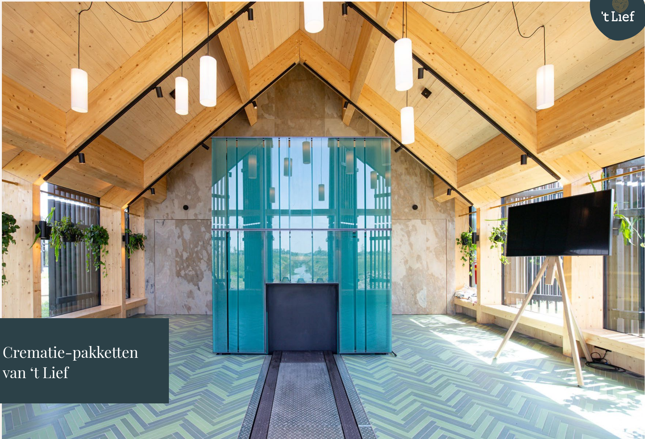
Crematie-pakketten van 't Lief